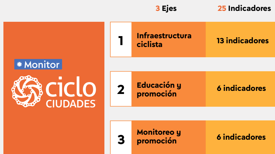
Figura 2. Ejes que componen el Monitor Ciclociudades 2025

Es importante aclarar que los indicadores no recibirán una calificación, esto para evitar establecer criterios arbitrarios de puntajes. En su lugar, cada indicador cuantitativo del Monitor Ciclociudades es normalizado con base en parámetros ajustados al contexto de cada entidad , lo que permite que los resultados sean comparables entre distintas zonas urbanas , sin perder de vista sus particularidades.